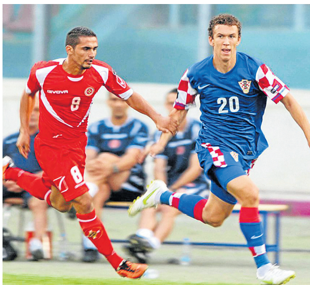
Za najboljeg se bori Ivan Perišić, nogometaš Borussia Dortmund