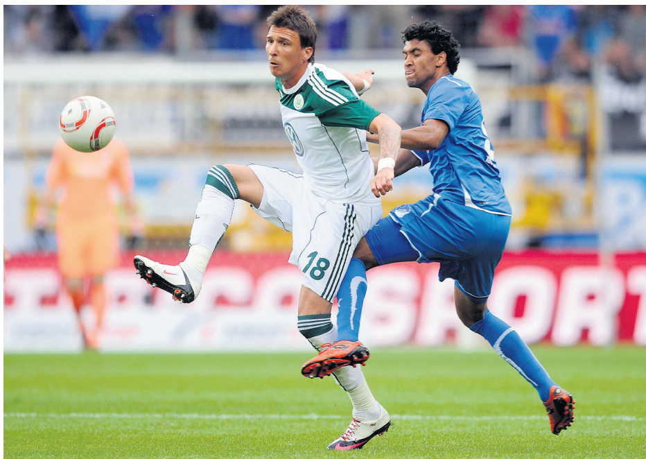
Mario Mandžukić također je na listi nominiranih