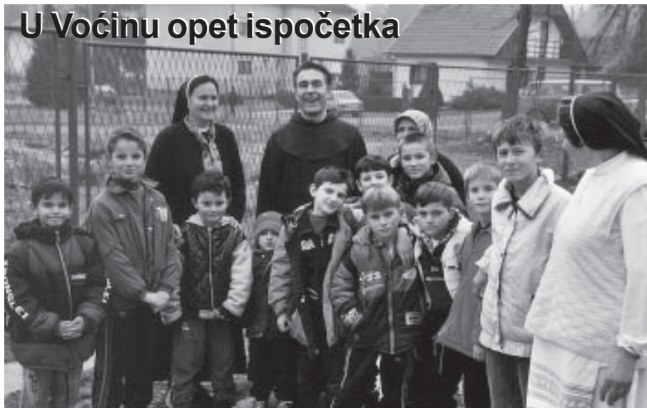
Voćin, 24. siječnja 2001. - djeca su budućnost Voćina