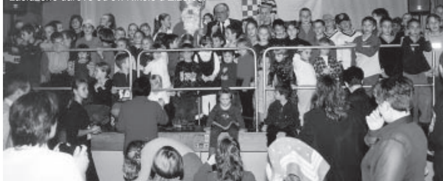
■ Djeca s nestrpljenjem iščekuju svoje zaslužene darove od sv. Nikole u Zizersu.