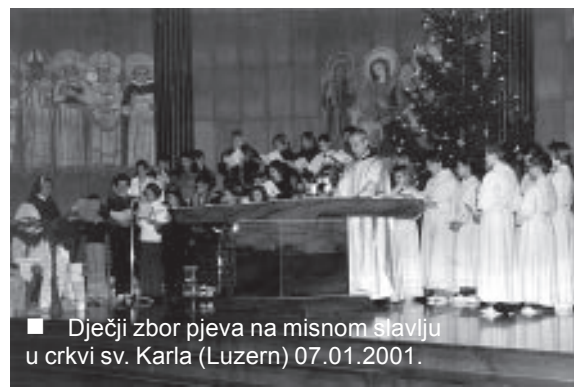
■ Dječji zbor pjeva na misnom slavlju u crkvi sv. Karla (Luzern) 07.01.2001.