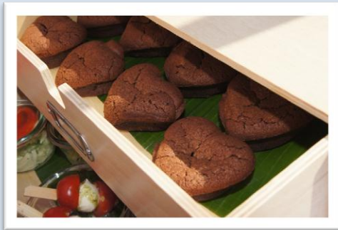
Trafo Baden, Jasmin Burkhalter