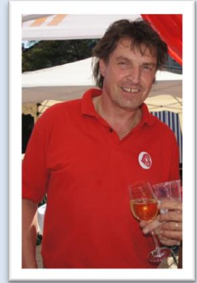
DENNER, Chr. Keller